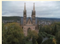
Remagen - Apollinaris-Kirche