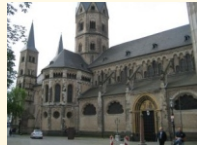
Bonn - Münster