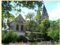
Koblenz - Basilika St. Kastor