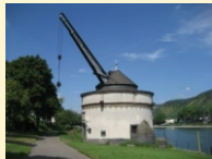
Andernach - Alter Kranen