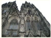
Köln - Dom