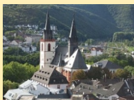
Bingen - Basilika St. Martin