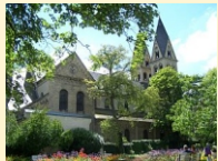
Koblenz - Basilika St. Kastor