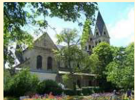
Koblenz - Basilika St. Kastor