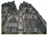
Köln - Dom