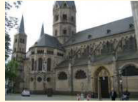
Bonn - Münster