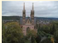
Remagen - Apollinaris-Kirche