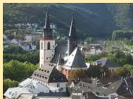
Bingen - Basilika St. Martin