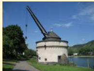
Andernach - Alter Kranen